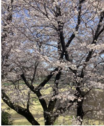
社員食堂からの眺め