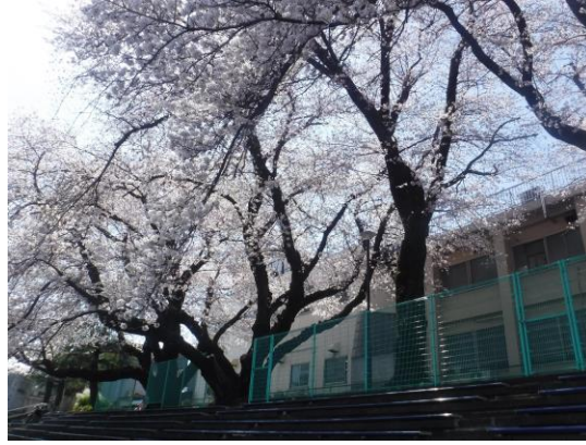
グラウンド横は桜並木です！