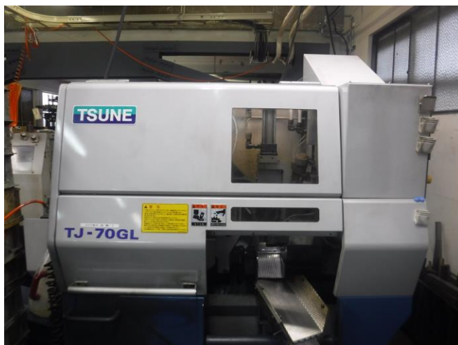
津根マシンの高速切断機